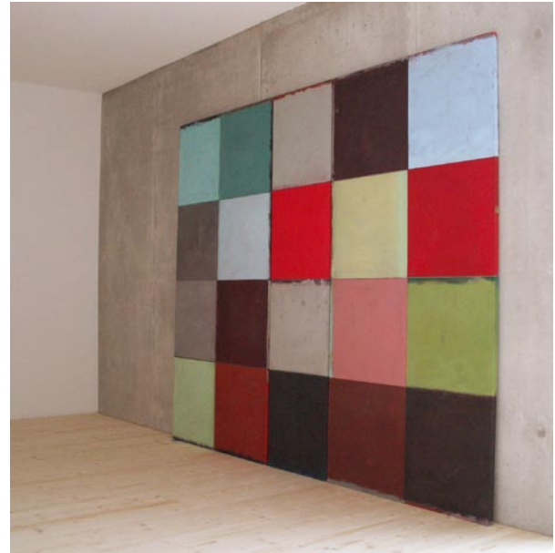
Gesuchte Farben, 200x250cm