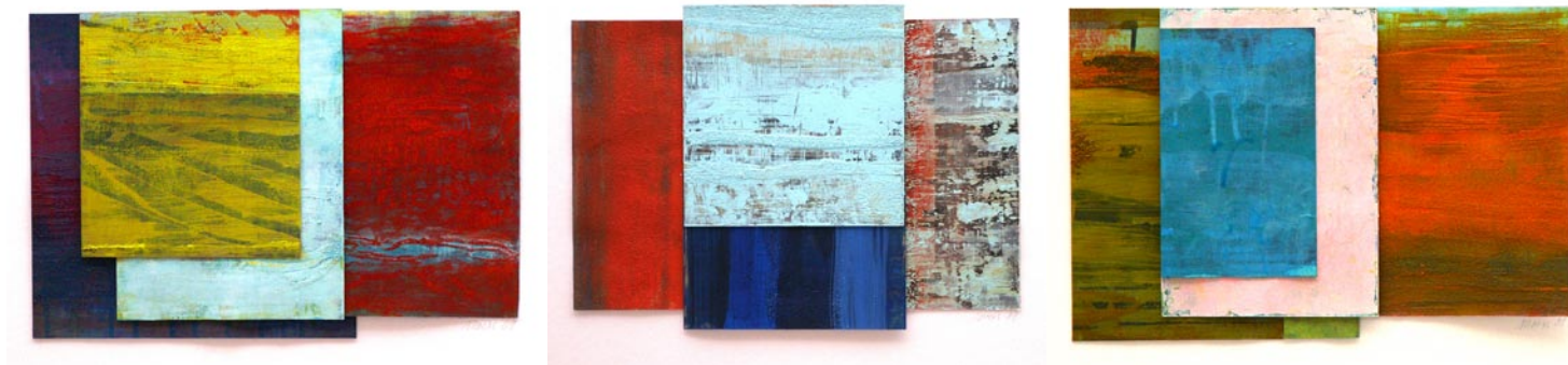
Gestapelte Farben, 2009, Pigmente und Acryl auf Karton, je 50x56cm