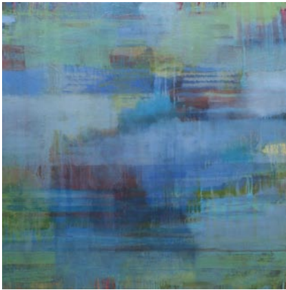
Hinter dem Schleier, 2010, Öl auf Baumwolle, 130x130cm