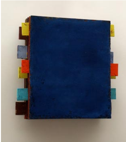
Holzobjekt geflochten, 2009, Öl, 35x37cm