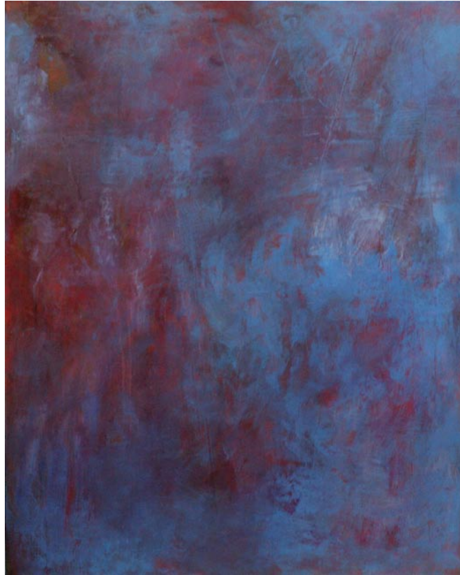
Blauer Farbraum, 2004, Acryl auf.Baumwolle, 150x120cm