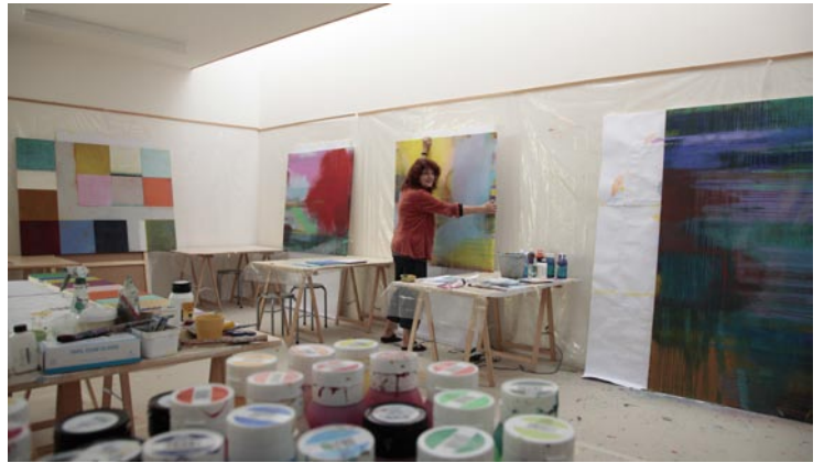
Raum für Kunst und Stille -- Atelier Moers