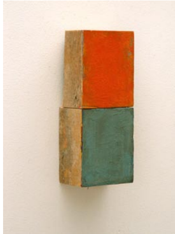
Bauholz, 2002, Pigmente, 28x11.5cm