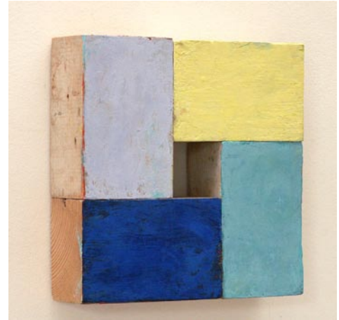
Bauholz, 2004, Pigmente, 30x30cm