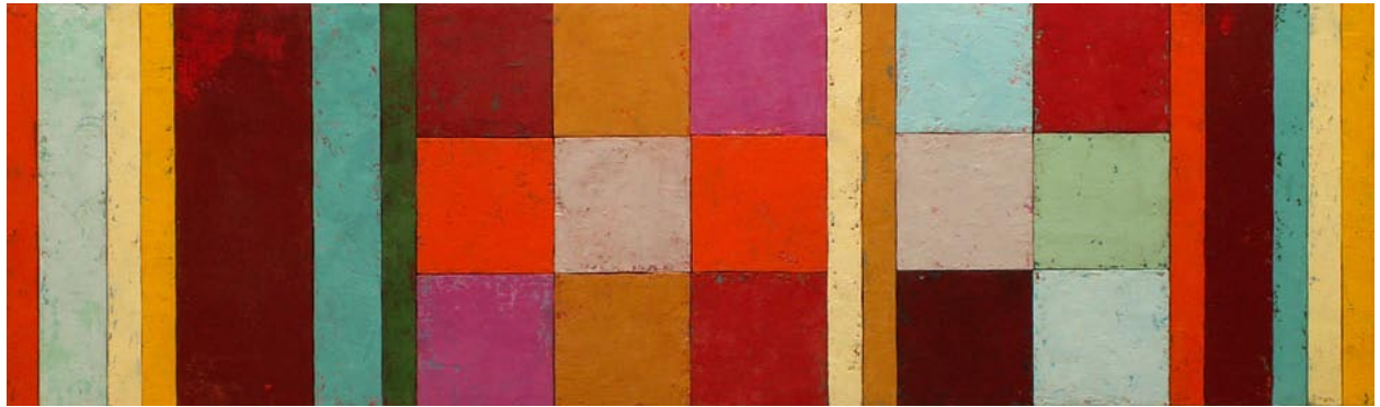
Rhythmus 2, 2009, Öl auf Pappelholz geschnitten, 45x180cm