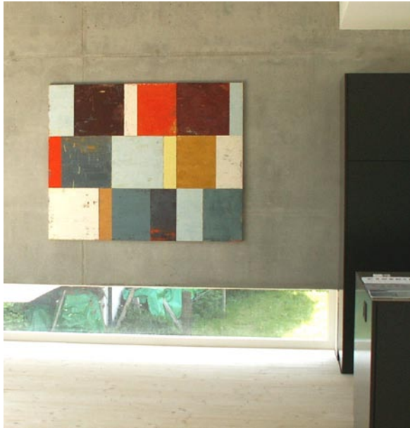
Farbfelder verschoben, 120x150cm