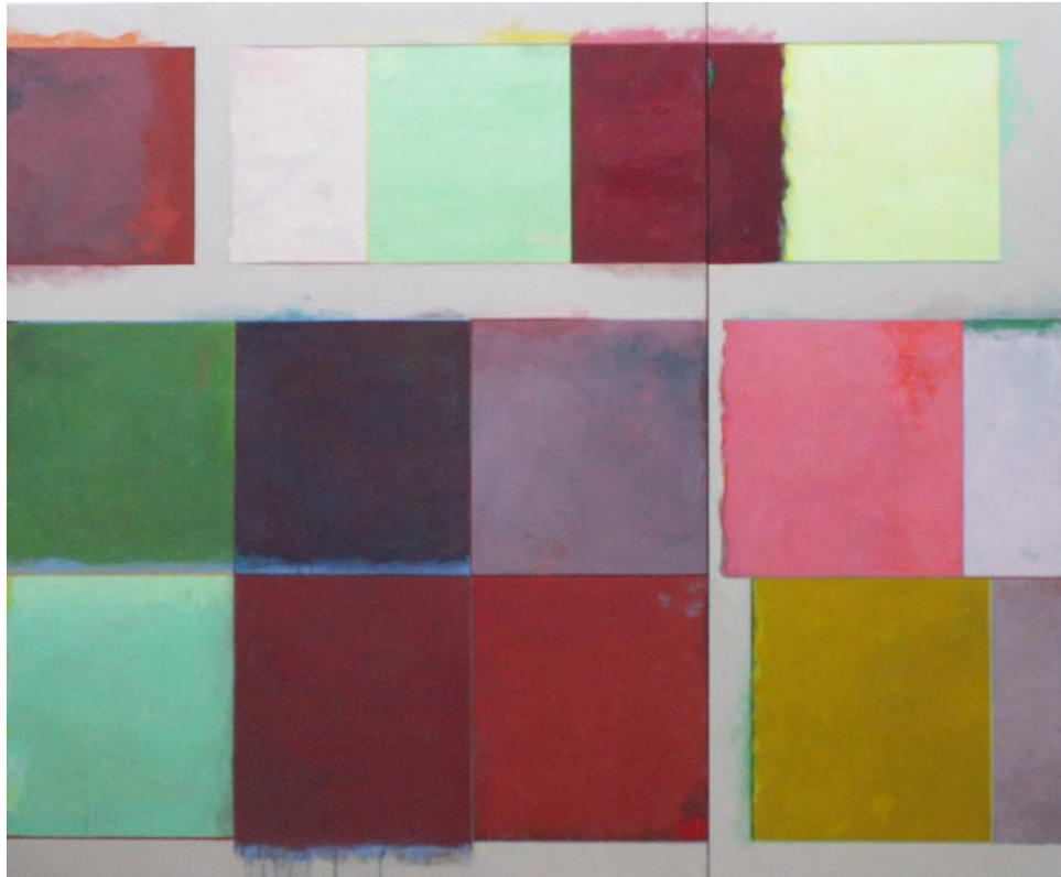
Farbfelder, 2010, Pigmente Acryl auf Leinwand, 150x180cm