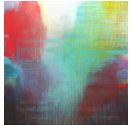
Dankbarkeit, 2010, Acryl auf Baumwolle, 130x130cm