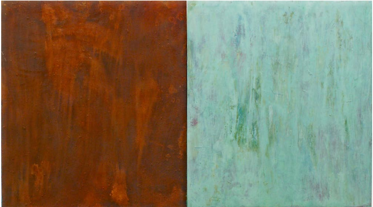
Rost und Kupfer, 2008, oxydierte Eisen- und Kupferpigmente auf Holz, 90x160cm